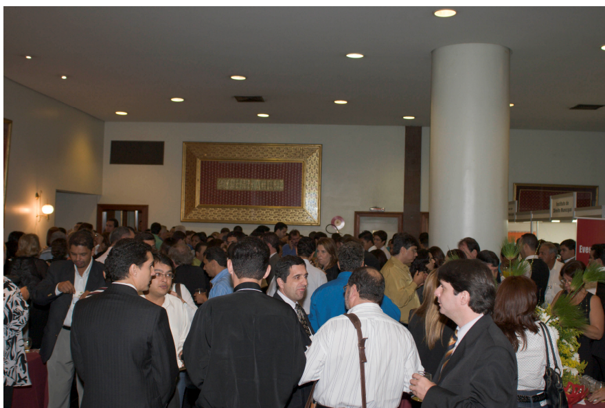
Aspecto do Coffee Break.

16 e 17 de abril de 2008 Dayrell Minas Hotel - Belo Horizonte