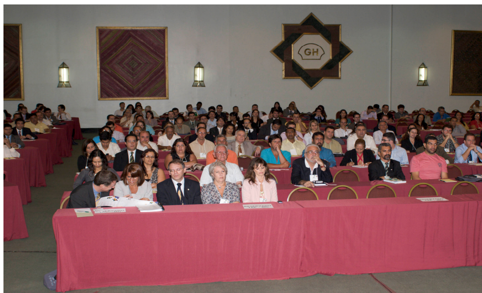
Aspecto do público presente.