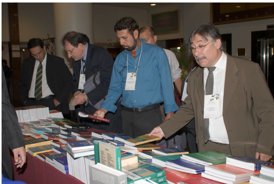
Atendimento Editora Fórum.